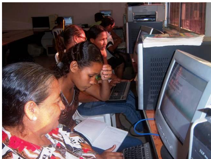
Gráfica 5. La foto muestra a jóvenes y adultos del Bajo Cauca Antioqueño beneficiarios del programa PAVA en el 20009.

Tanto en el aula de clases como en la de informática, está el facilitador como guía y apoyo al proceso de aprendizaje del estudiante. Es importante destacar que la presencia del facilitador genera confianza en el joven y adulto que aprende.